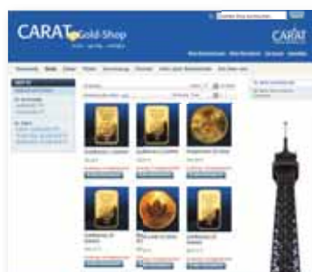
Neu im Web: CARAT Gold-Shop

Aufgrund der hervorragenden Verbindungen des CARAT Gold-Shop zu den Lieferanten und Herstellern der physischen Edelmetalle wie beispielsweise Heraeus und Umicore kann der BCA Partner sein Dienstleistungsangebot mit qualitativ hochwertigen Edelmetallen erweitern. Das Produktsortiment umfasst Gold-Barren, Gold-Münzen, Silber-Barren, Silber-Münzen und Platin-Barren.